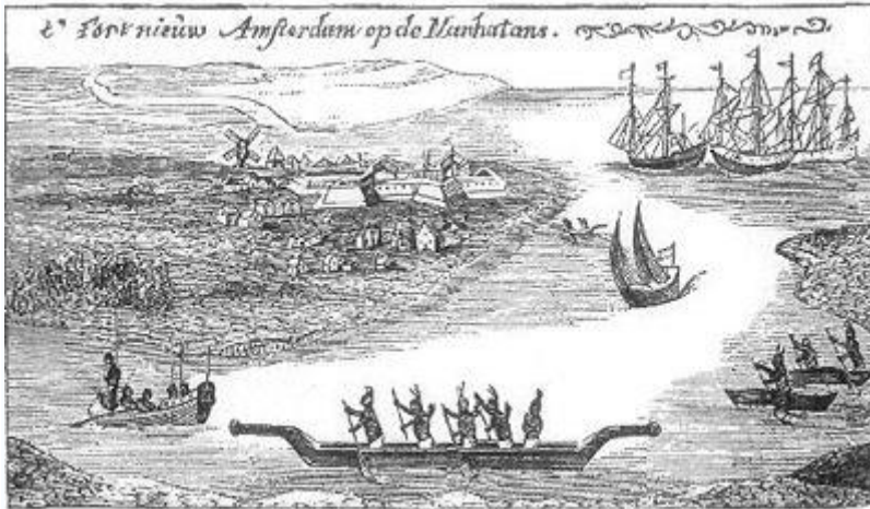
De oudst bekende kaart van Nieuw-Amsterdam

Verhulst was niet populair als directeur, voornamelijk door zijn slechte beheer van de financiën van de kolonie en zijn slechte behandeling van de kolonisten die hij zag als gewone werknemers van het bedrijf. Begin 1626 werd Verhulst vervangen door Peter Minuit . Als onderdeel van de bouwwerkzaamheden van het fort begon Minuit met zijn beleid om Manhattan te 'kopen' van de lokale Lenape-bevolking voor handelswaar ter waarde van zestig gulden.